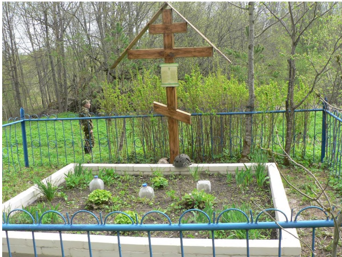
Воинское захоронение в д. Доброе

свалившегося замертво от нашего огня фашиста. Вот и на этих полях, в этих сёлах, на этих дорогах бойцы и командиры нашей дивизии и сапёрного батальона сделали всё возможное и невозможное, чтобы остановить врага, задержать его, не дать пройти лёгким маршем к Москве».