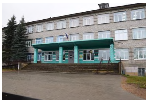
Пеновская средняя школа